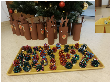
Warsztaty z wolontariatu