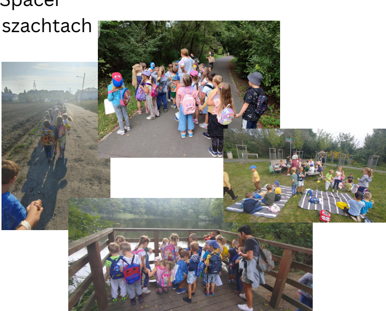
Spacer po szachtach