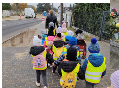
Wyjście na cmentarz