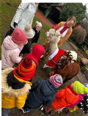
Kulturka - tradycje świąteczne